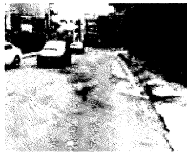
VIA CASALE DEI GRECI

«Anche se l'incidente mortale si è verificato nel ter-