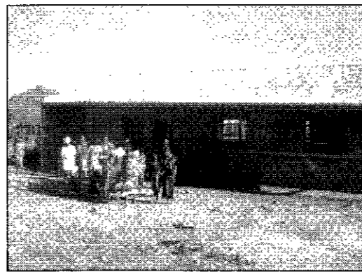
Un'altra immagine della scuola

Ogni estate i volontari della parrocchia partono per portare il proprio aiuto nelle missioni africane