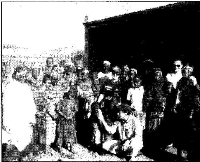
Alcuni abitanti del villaggio con i volontari di Sant'Antonio