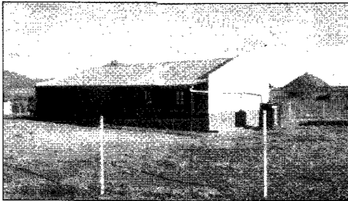
La scuola realizzata con i fondi raccolti nella parrocchia di Sant'Antonio

L'iniziativa, inoltre, è stata sostenuta dalla Provincia di Brindisi che, nell'ambito della propria attività istituzionale, ha inteso attivare interventi di carattere programmatico anche in forma contributiva, con le associazioni che operano, tra l'altro, in apposite iniziative tendenti a favorire lo sviluppo socio-culturale di determinate popolazioni.